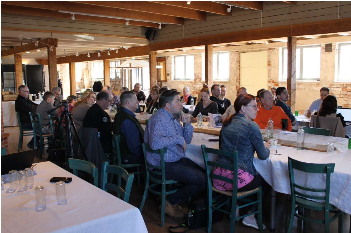
Yhdistysten kokousedustajia MTK-Uusimaan kevätkokouksessa Knehtilässä 22.4.2022.