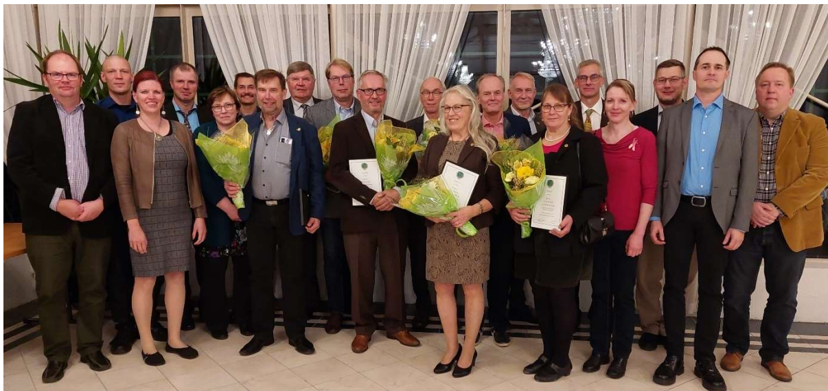
Ansioituneiden jäsenten muistamistilaisuus Hirvihaarassa 5.10.2022.